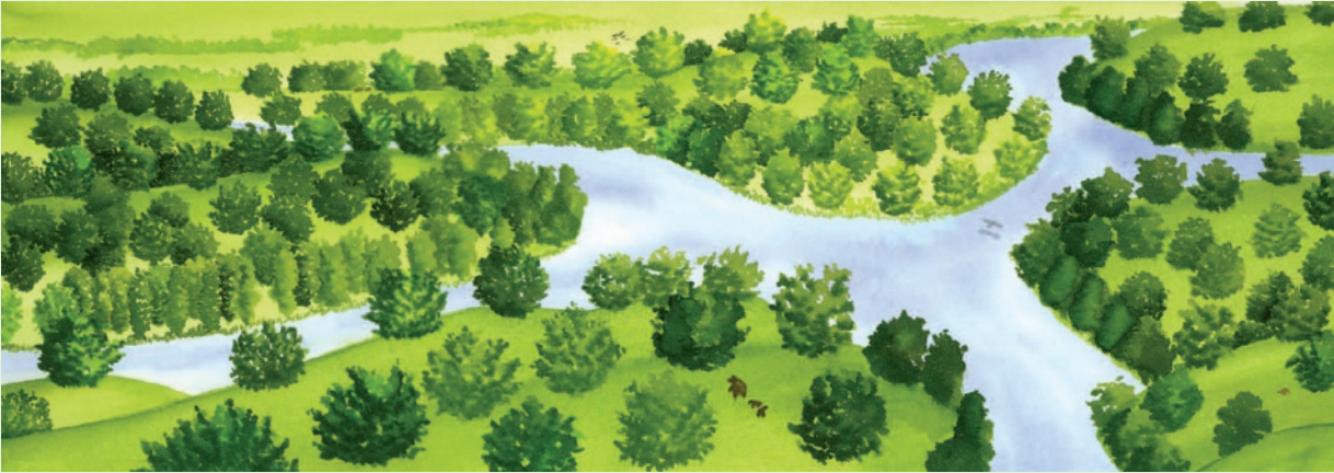
A taldea. Gizakia azaldu baino lehenagoko landaretzari zein faunari buruzko dokumentazioa bila dezakezue.