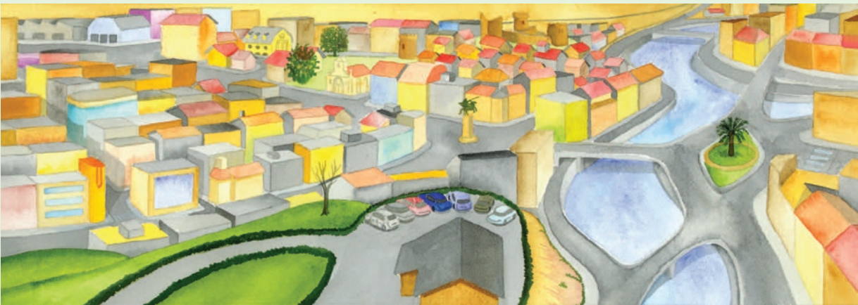
D taldea. Etorkizunari buruzko ikusmoldeak eztabaida handiagoa piz dezake. Etorkizuneko paisaia oraingo erabakien menpe dago.