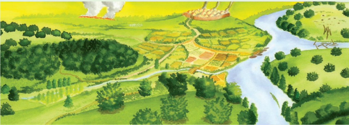
B taldea. Historiaurreko ikuspegi honetan, geure subkontzientearen zine eta telebista irudimenaz ohar gaitzek.