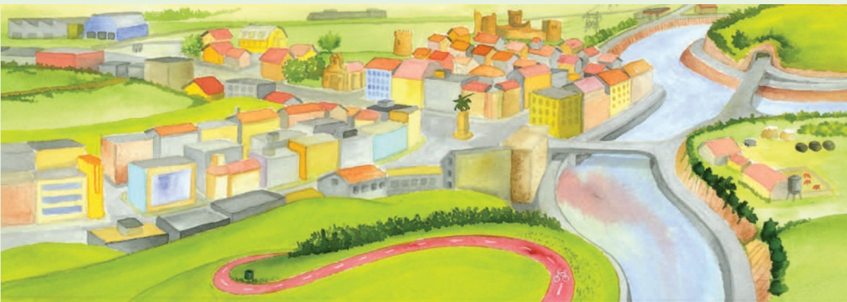
C taldea. Asfalto eta komunikabideen garaia. Nahiz eta itxuraz aldatu gabeko paisaia bat aukeratu, gizakiaren aztarna beti egoten da atzean.